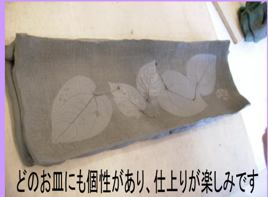
どのお皿にも個性があり、仕上がりが楽しみです