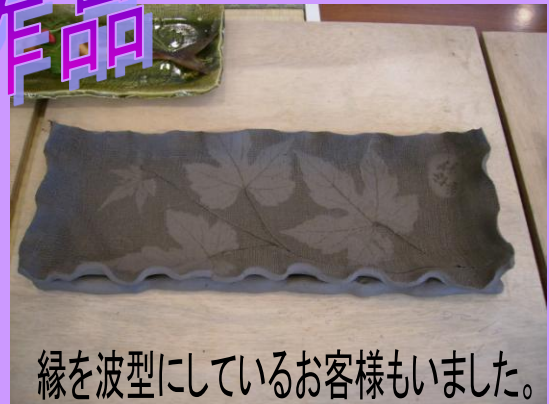
縁を波型にしているお客様もいました。