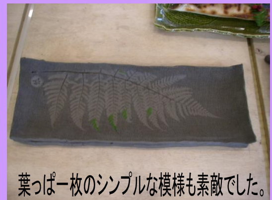
葉っぱ一枚のシンプルな模様も素敵でした。